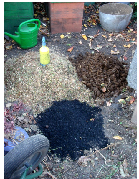
Zutaten für Terra Preta